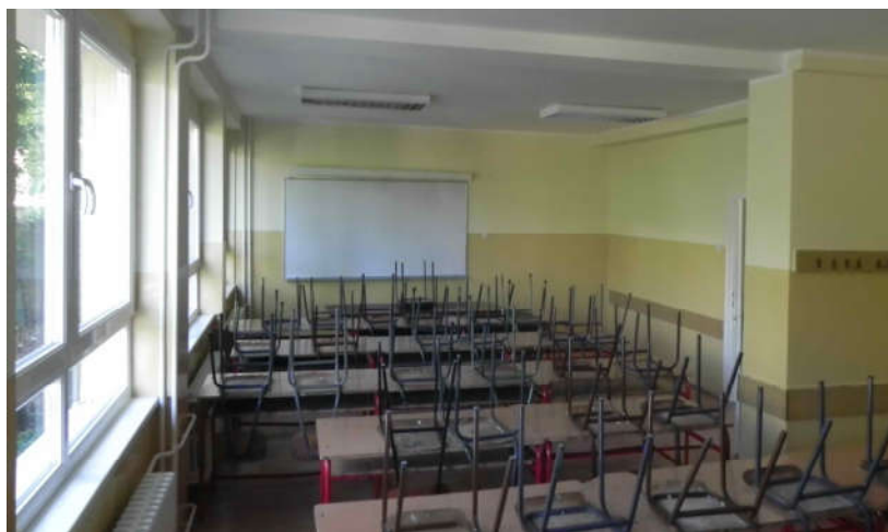
Учионица за групу правних предмета

Школска библиотека опремљена је литературом која се стално унапређује са циљем да обогати и унапреди процес учења и усвајања знања како ученика тако и запослених.