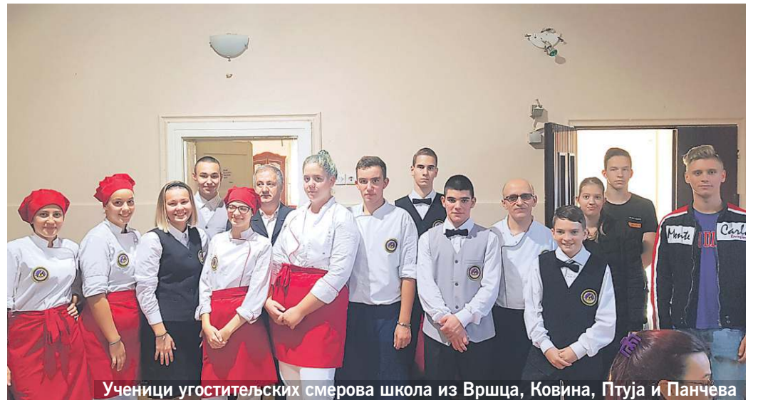
Ученици угоститељских смерова школа из Вршца, Ковина, Птуја и Панчева