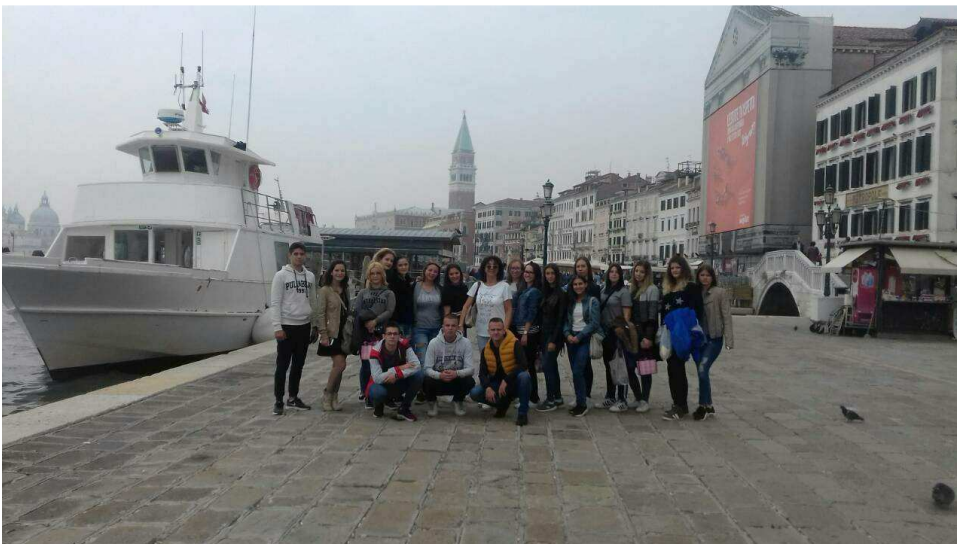
4/5 у Венецији