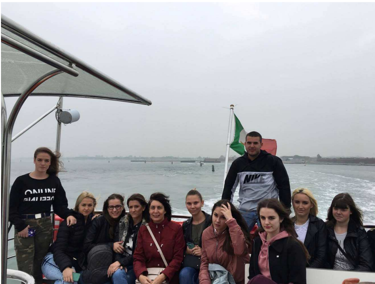
4/1 на истом путу