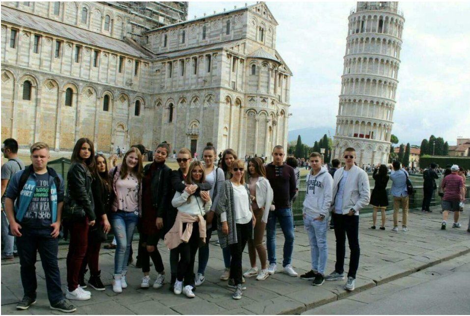
4/3 у Пизи