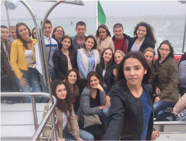
4/4 на путу за Венецију

Када сложимо све ове коцкице, добијамо једну веома лепу и трајну слику, која ће нам дуго остати у лепим успоменама.